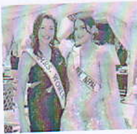
विधानसभा काठमाडौं, ११ पुष्प

बर्हिवासीको नाम सेनाका सभ्यता मिसेस वर्ल्ड-२०२३ को नेपाल प्रतियोगिता विजय प्राप्त गर्नुको साथै मिसेस वर्ल्ड-२०२३ को ह्युमनिटेरियन अवार्ड प्राप्त गर्नुको सम्बन्धमा जानकारी दिनुपर्ने।