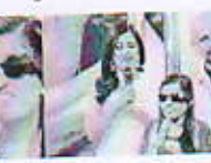
विधानसभा काठमाडौं, ११ पुष्प

मेनुकालाई एआई जडित चरमा गर्नुको सम्बन्धमा जानकारी दिनुपर्ने।