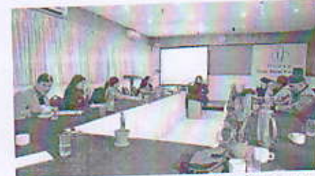
विधानसभा काठमाडौं, ११ पुष्प

अपांगता भएका व्यक्तिको अधिकार प्राप्तिमा सांसदहरूले भूमिका खेल्न माग गर्नुको सम्बन्धमा जानकारी दिनुपर्ने।