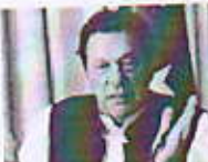
विधानसभा काठमाडौं, ११ पुष्प

पाकिस्तानका पूर्वप्रधानमन्त्री इमरान खानलाई १० वर्षको जेल सजाय दिनुपर्ने।