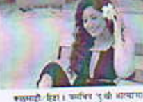
विधानसभा काठमाडौं, ११ पुष्प

'दुःखी आत्मा मा आँचल' लेखनुको सम्बन्धमा जानकारी दिनुपर्ने।